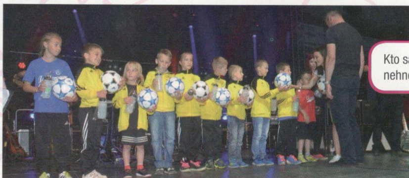
Kto sa hraje, nehnevá

A k tomu kopec ďalších splnených snov. Obrovských, a pritom veľmi jednoduchých. Viac sa o nich dočítate na našej webovej stránke www.pierott.com alebo na našej FB stránke @pierottcom.